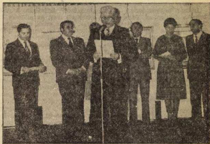
Horn Dezső miniszterhelyettes megnyitja a kiállítást

Dr. Barbiero azzal fejezte be közvetlen, baráti hangú beszédét, hogy osztja Schopenhauernek azt a tételét, miszerint a dilettánsok — mivel minden anyagi érdek nélkül törekednek a maguk és a mások gyönyörködtetésére — tulajdonképpen a legszíntébb alkotók. Ezért reméli azt is, hogy e szó legszebb értelmében vett dilettantizmus mindinkább elterjed, és a magyar és az olasz postások példáját követve más európai országok is bekapcsolódnak a kulturális kapcsolatok formájába, új irányt szabva ezzel az amatőr képzőművészet fejlődésének is. „Együtt nézik majd a csillagokat a művészekkel és a tu-